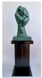
ชื่อศิลปิน : จุฑารัตน์ บุตรเพียน ชื่อผลงาน : Human Face Expressions เทคนิค : ไม้เนื้อแข็ง , โลหะ ขนาดงาน : 17x19x62 cm ปี พ.ศ. : 2567